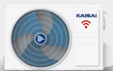
kültéri egység KWX